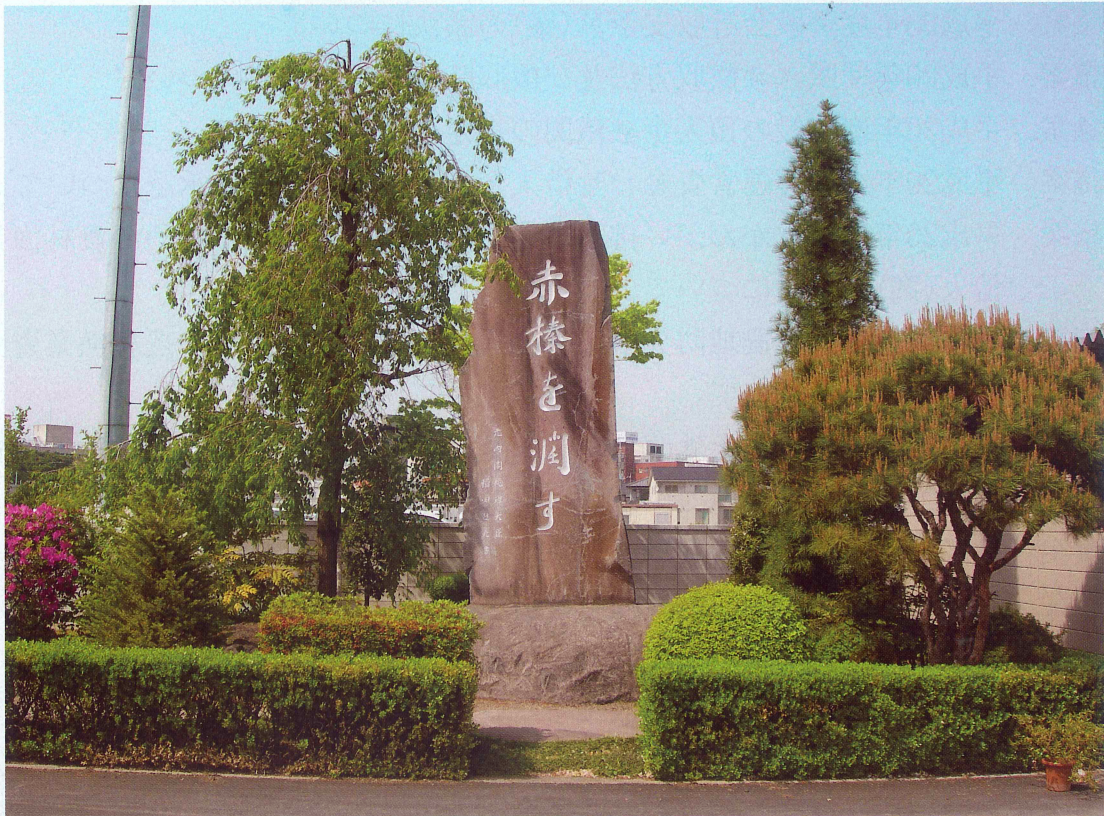
群馬用水竣工記念碑

私たちは、この偉大な事業を後世に受け継ぐべく、これからも努力を重ね、組合員の皆様とともに歩んでまいります。