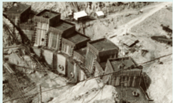
矢木沢ダム建設の状況

昭和13年に策定された「河川統制計画」は戦争の激化で自然消滅の形となり、問題はすべて戦後に持ち越されました。昭和20年、終戦からの復興に向けて電力不足に対応するため、発電事業が急ピッチで進められました。発電所は順調に完成していきましたが、灌漑用水・水道用水の水源となる矢木沢ダムの建設は先送りされてしまいました。しかし、昭和25年にダムの発電に関する権利が群馬県から、日本発送電（現東京電力（株））に譲渡されたこともあり、昭和27年に策定された「利根川特定地域総合開発計画」に矢木沢ダム計画が明記されました。