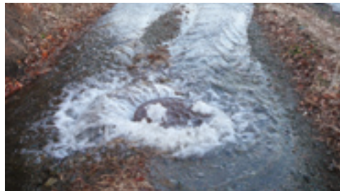
空気弁からの漏水