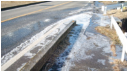
漏水による路面凍結

気温が低下した条件下での漏水は、路面凍結によるスリップなど重大な事故につながる危険があります。もし、漏水を発見したら 土地改良区 か管内市町村役場群馬用水係までご一報ください。