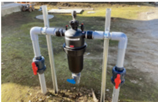
除塵機(フィルター)の設置状況

また、フィルター清掃の労力軽減、時間短縮が精神的負担を軽くし、今後は作物の生産拡大・品質向上が期待されるところです。令和4年度は、灌水ホースの導入促進を行う予定です。土地改良区では、様々な方法で組合員さんの営農活動を支援していきます。