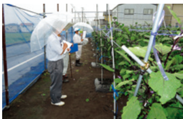
審査員によるナスほ場での審査

令和3年8月17日(火)、群馬用水管内の各JAから推薦された露地ナス農家の9ほ場（桐生市新里町、前橋市、渋川市、榛東村、高崎市箕郷町）を回りながら、群馬用水営農推進協議会主催の立毛審査会が行われました。