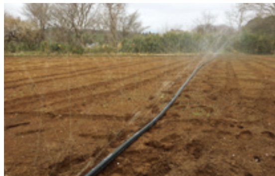
41°の角度で散水できる灌水ホース