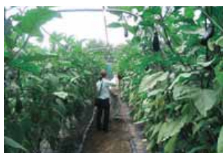
露地ナス立毛共励会

群馬用水営農推進協議会では、露地ナス・秋冬ネギの共励会(立毛)を実施して、野菜の推進奨励を図っています。群馬県の重点推進品目のナス・ネギは、最も伸びる可能性のある野菜として位置づけられていて、特に水の有効利用でナスのつやなし果(ぼけ果)の発生が抑えられ品質向上と収量増加が期待できます。また、作付けにあった灌水機材の相談にも応じています、お気軽にご連絡下さい。