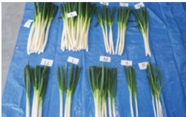
秋冬ネギ規格審査