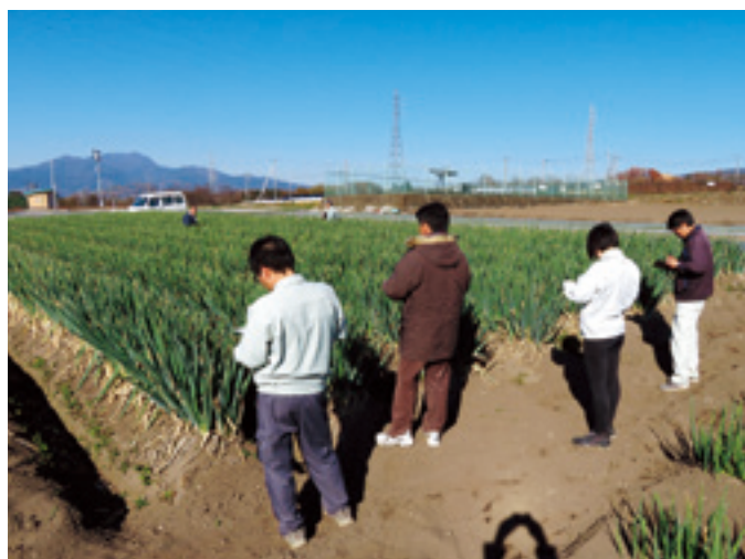
秋冬ネギほ場審査

各種共励会は、品目毎の審査基準に基づき採点を行い参加者の順位を決定し、入賞者を2月に開催される群馬用水地域利水グループ体験発表会及び各種表彰式で表彰します。