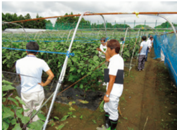
露地ナスほ場審査