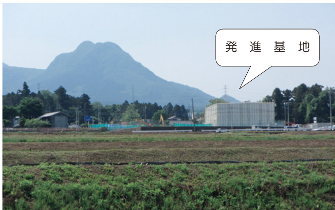
発進基地 (吉岡町大字上野田)