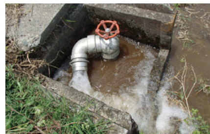
大切に使用いただき、ありがとうございます。

昨年度は、利根川水系において記録的な渇水に見舞われ群馬用水も取水制限を受けましたが皆さんのご理解とご協力により大きな影響もなく夏期かんがい期を乗り越えることができました。本年度も、土地改良区では皆さんの農地へ用水を安定供給できるよう配水調整・施設整備等を行っていきますが組合員の方々のご協力なくしては円滑に配水することはできません。是非とも配水調整について、皆様のご理解ご協力をお願いします。