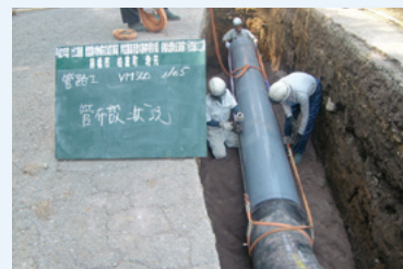
塩化ビニル管布設