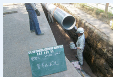
塩化ビニル管布設

昨年度実施事業により整備された施設(県営農村地域防災減災事業 東部1号支線・前橋市粕倉町)