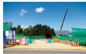
北群馬郡吉岡町大字上野田地内

工事期間中、ご迷惑をおかけいたしますが、皆様のご理解とご協力をよろしくお願いいたします。