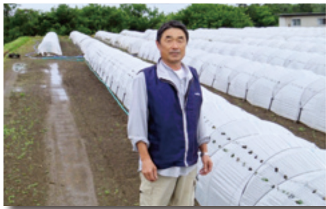
定植後のナスのトンネル前にて

結び 今日は、大変お忙しい中ご協力いただき、ありがとうございました。美味しいナスが収穫できることを期待しています。