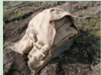
【凍結防止対策】ワラ・もみガラ・毛布・ビニール等を詰めて保護して下さい