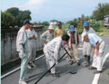
(前橋市富士見町地内)