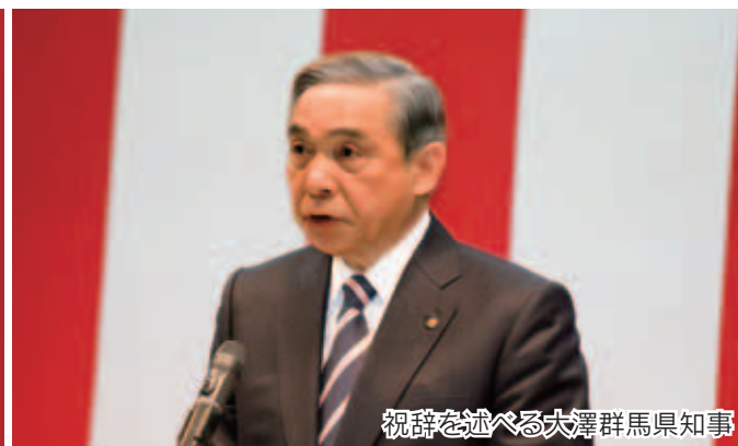
祝辞を述べる大澤群馬県知事