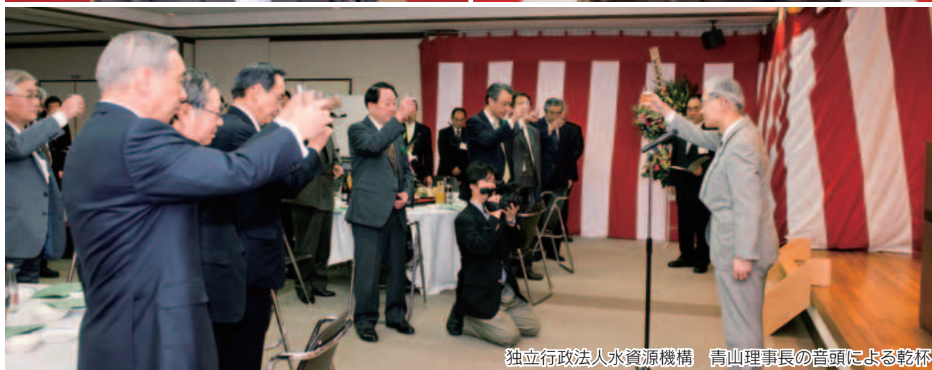
独立行政法人水資源機構 青山理事長の音頭による乾杯