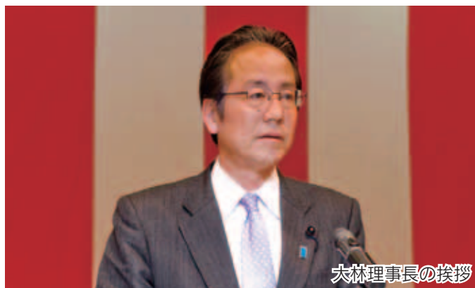
大林理事長の挨拶

今年の田植えも、昨年同様ほぼ順調に行われており、受益者の皆様がよりよい実りの秋を迎えられることを願っております。