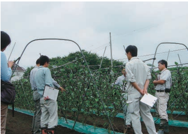
ナス立毛共励会（9月3日）