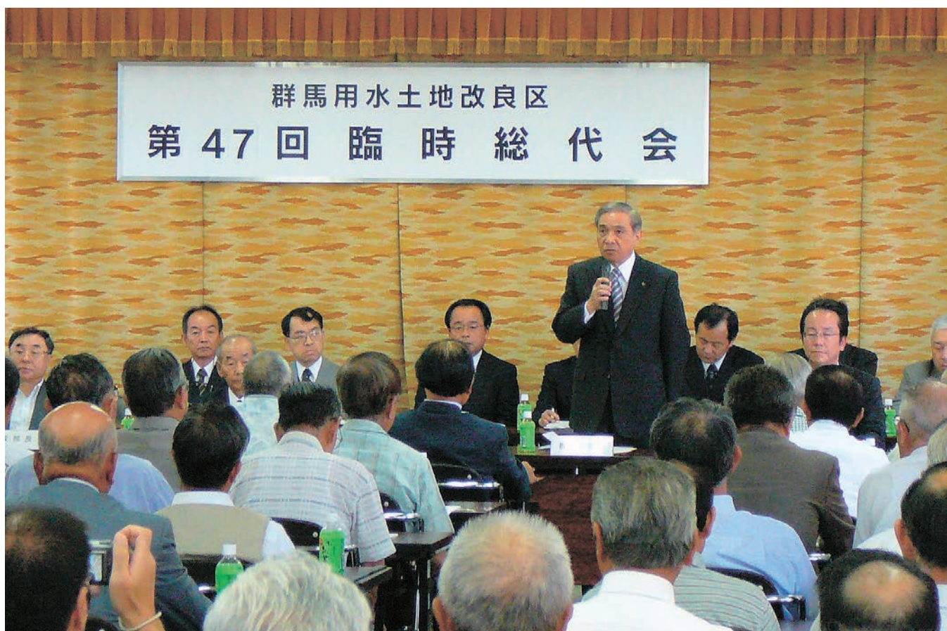
第47回臨時総代会において祝辞を述べる大澤知事