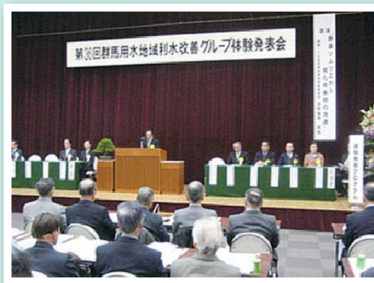
富澤会長のあいさつ